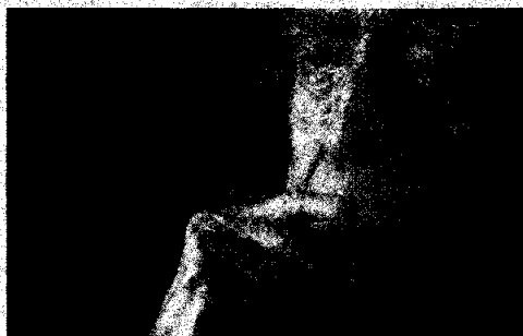
Arriba, el Auditorio de Sídney, de Utzon. Al lado, portada del DVD de Niemeyer. Debajo, Le Corbusier en la India con Nehru. Al lado, Oscar Niemeyer.